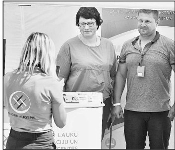
Zemes saimniekiem bija iespēja saņemt LLKC speciālistu konsultācijas.