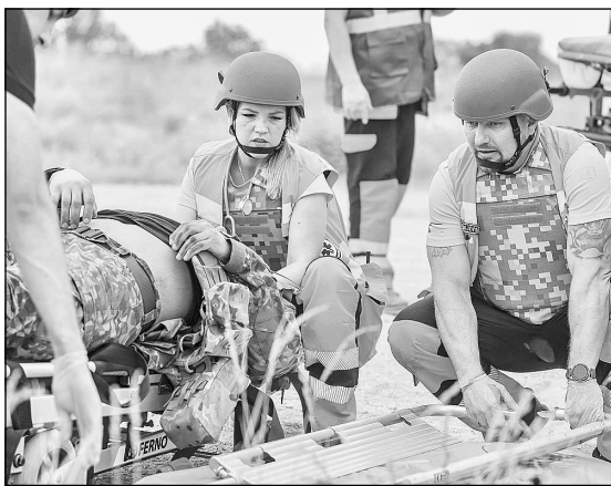
NMPD medicīni sniedza palīdzību notikuma vietā, savukārt Medicīnas telti nepieciešamības gadījumā tika veiktas ķirurģiskas manipulācijas.