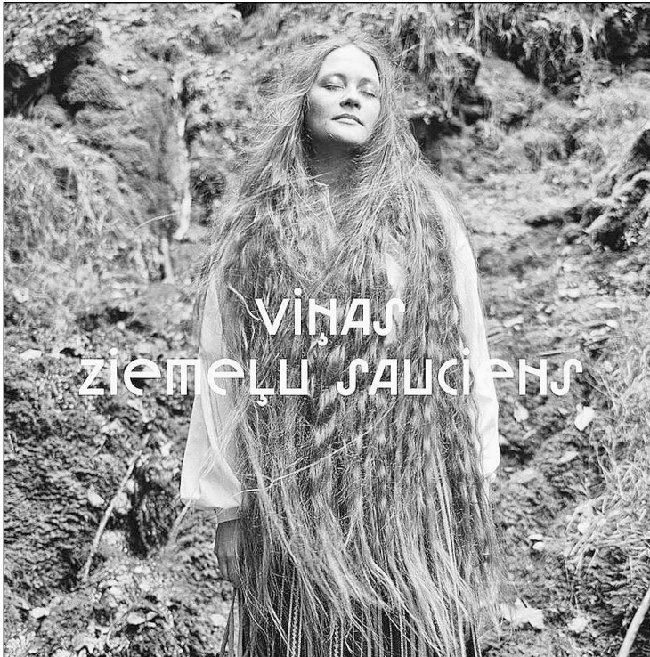
Izstādes autori un Madonas novadpētniecības un mākslas muzejs aicina aplūkot ziemeļnieciskās baltu sievietes pasauli caur rotu, stāstu un fotogrāfiju prizmu.

"Manas iedvesmas sievietes ar savu darbošanos vairo pašapziņu par sevi, par valsti, par saknēm. Fotogrāfiju stāstījuma valoda ir melnbalta, gaismu un ēnu, melnā un baltā spēlēs atklājot katru