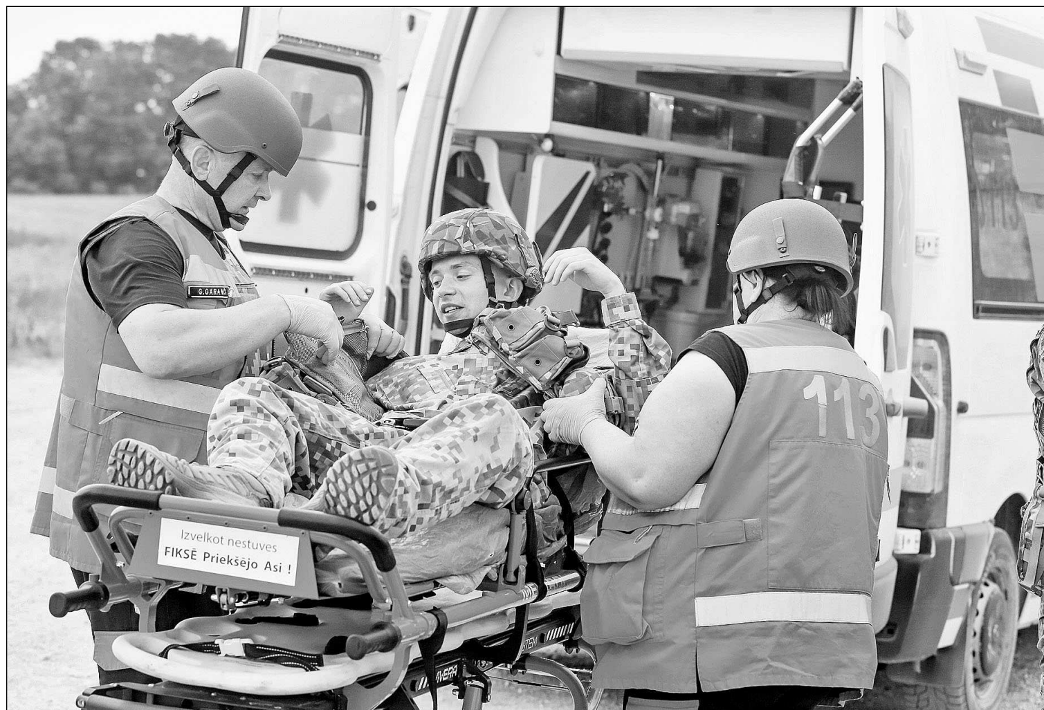
Mediķi cietušos aprūpēja un nogādāja medicīnas iestādēs.