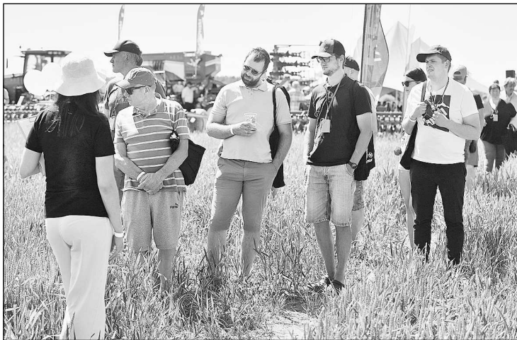
"LATRAPŠ" agronomi-konsultanti novērtē labību.