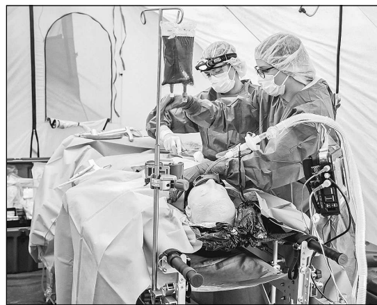
AGRA VECKALNIŅA foto

tehnoloģijām un navigācijai, bija jāizmanto koordinātas un papīra karte cietušo pārņemšanas punktu atrašanai, kā arī cietušo apmaiņa drīkstēja notikt tikai tad, kad dienesti savstarpēji sazinājās, izmantojot iepriekš atrunātus signālus. Šīs mācības bija vērtīga pieredze, kas ļaus būtiski uzlabot dienesta gatavību ārkārtas situācijās, notiekot militāram konfliktam.