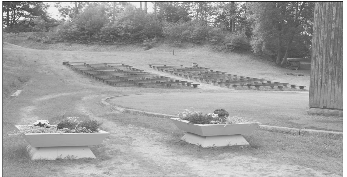
Kusas estrādē atjaunoti soliņi, kurus bija skāris laika zobs. Tāpat ĪUN darbinieki raduši risinājumu, lai ar automašīnām nebrauktu estrādē, uzstādot masīvus puķu podus.