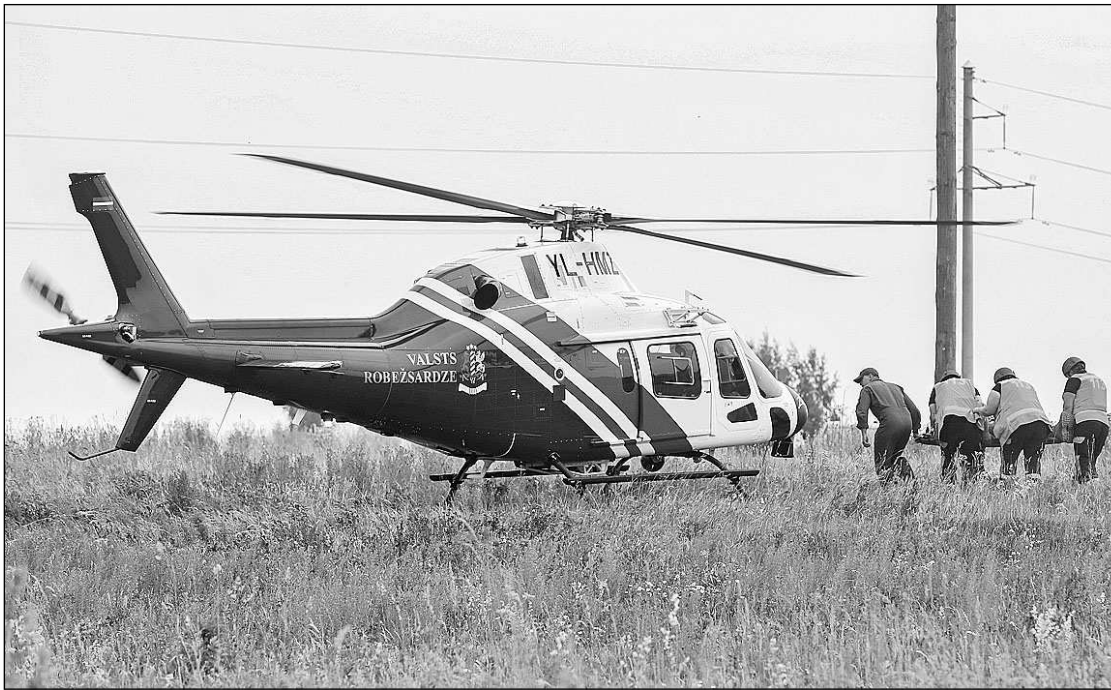
Mācībās piedalījās Valsts robežsardzes helikopters, kas cietušo nogādāja Madonas slimnīcā.

Katrās mācībās mums ir jauni secinājumi, un katrām nākamajām mācībām varam izvīzēt jaunus uzdevumus. Katra krīze ir unikāla ar to, ka tai ir atšķirīgi apstākļi un koordinācijas situācijas, tāpēc šādas mācības ir ļoti vērtīgas, un ir jāturpina tās organizēt, lai dienesti būtu gatavi savstarpēji sazināties un sastrādāties. Mācību laikā dienesta medicīniekiem, pretstatā ikdienas situācijai, kad darbs norit, pateicoties modernajām