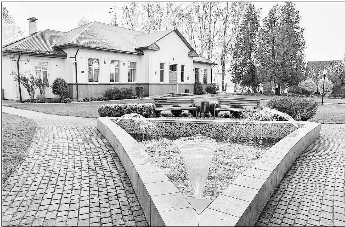
Drīz kultūras namā Lubānā sāksies pārbūves darbi.

— Īstenojot iecerēto pārbūvi, nepieciešams EUR 912 035,19, ieskaitot PVN. Ir jau veikta ie-