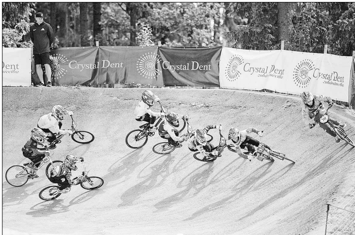
"Smeceres silā" BMX trase ir vienīgā, kas izveidota iepakā. Publicitātes foto

— Madonas posms notika paralēli Eiropas kausa sacensībām, tādējādi iztiekot bez vadošajiem elites, U23 un junioru sportistiem. Sacensības norisinājās Madonas pilsētas svētku atskaņās. BMX kluba "Madona" pārstāvji, sportisti un vecāki ieguldīja nozīmīgu darbu, lai BMX trasē "Smeceres silā" tiktu