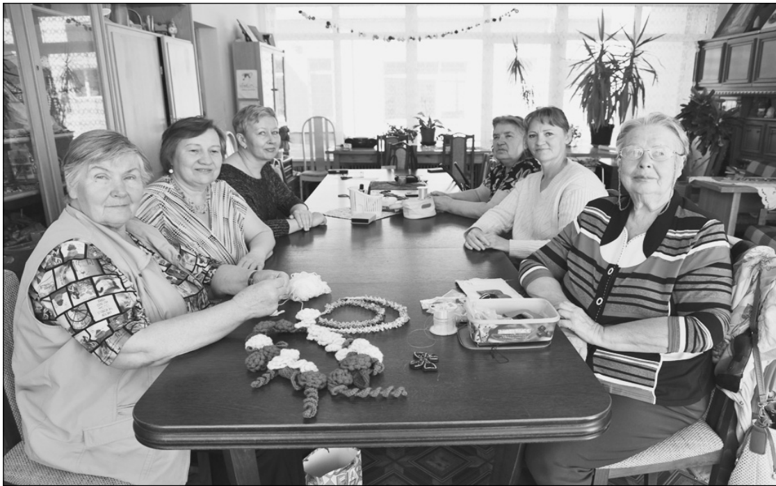
Uz nodarbībām dalībnieces brauc gan no Madonas, gan no citām apkārtnē vietām un pat no citiem novadiem.